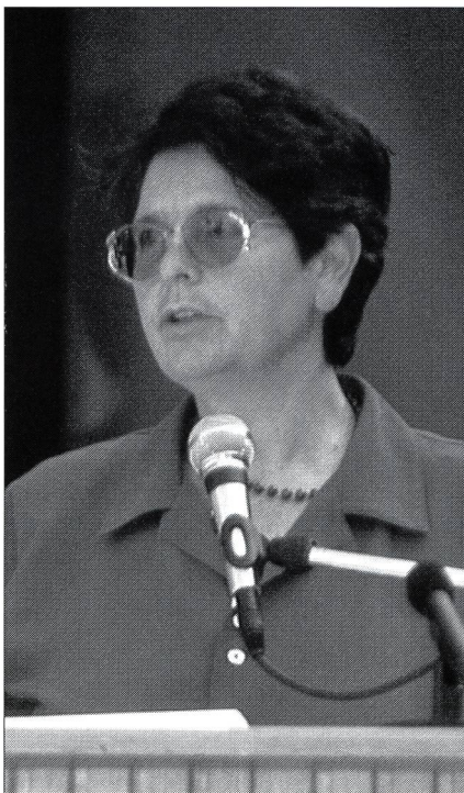
Ruth Dreifuss, ministre du sport, prend congé d'un public qui lui tient à cœur: les jeunes!

de motivation personnelle et de richesse de la relève; c'est également un problème de sélection et de formation. En fin de compte, c'est un problème qui dépend de la valeur qui est accordée, dans notre société, au sport.