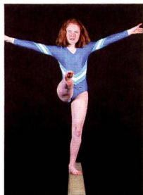
Avant-première du prochain numéro de «mobile»

Adresse: Biokosma S.A. Kapplerstrasse 55, 9642 Ebnat-Kappel. Tél. 071/992 63 10, fax 071/992 63 15.