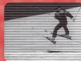
Du ski alpin aux sports de neige Fr. 25.90