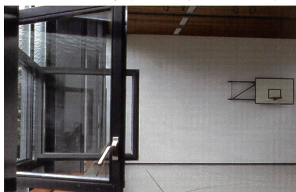
Une fenêtre ouverte... l'accident garanti.