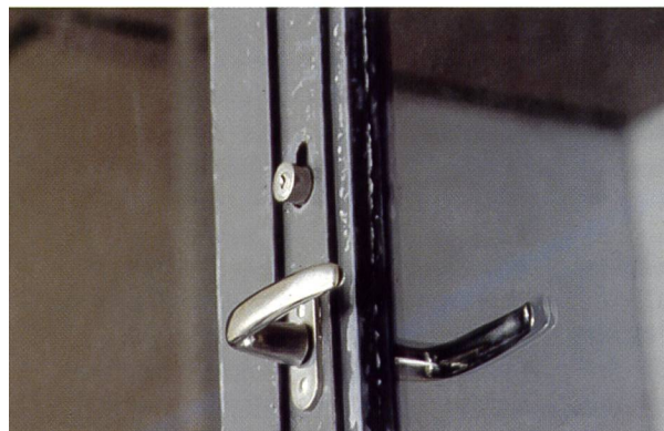
Une poignée proéminente et des radiateurs non recouverts ...

Les installations sportives sont-elles sûres en Suisse? Si on ne saurait l'affirmer catégoriquement, les statistiques et les contrôles réalisés par les spécialistes du Bureau suisse de prévention des accidents (bpa) lors de nouvelles constructions ou de transformations montrent qu'en tous les cas, une chose est sûre: Elles ne sont pas dangereuses.