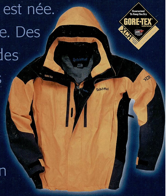
Modèle MOUNTAIN GUIDE JACKET (CHF 699,-)

Schöffel innove dans le secteur haute montagne. Des matériaux extrêmement légers et robustes, des coupes équilibrées et un design qui comble tous les vœux ! Le clou de la collection est la veste Mountain Guide en GORE-TEX® XCR D/Max Light, un malabar sur le plan fonctionnel , mais un concentré énergétique 100% fonctionnel et un poids plume offrant un maximum de confort.