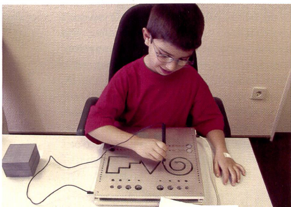
Motricité fine et dextérité. Les évaluations se font à tous les niveaux.