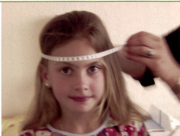
Tout est sujet à mesures...