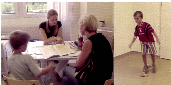
Après les tests, la discussion. Les parents sont impliqués dans la recherche de solutions.