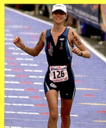
Karin Thürig: Championne Olympique juniore

A l'aide de cet entraînement je peux utiliser efficacement l'entier de mon potentiel.