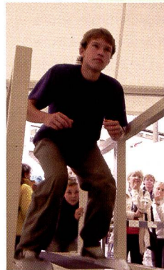
Public bigarré, activités pour tous... Science et sport ont fait bon ménage.

Ces journées scientifiques, lancées par la Fondation Science et Cité, ont vu le jour grâce à la coopération avec l'Office fédéral du sport de Macolin et de sa Haute école fédérale de sport, ainsi que l'Institut des sciences du sport et de l'éducation physique de l'Université de Berne. //