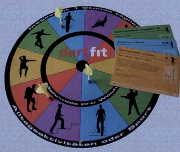
dartfit Die Bewegungsscheibe

Mit der Dartfitscheibe können die Dimensionen der gesundheitswirksamen Bewegung spielerisch erfahren werden. Nach dem der Pfeil seinen Platz auf der Scheibe gefunden hat, zückt man ein entsprechendes farbiges Kärtchen, liest die Bewegungsaufgabe vor und setzt sie gemeinsam um. Dartfit kann für kleine Bewegungspausen in jedem Schulzimmer eingesetzt werden.