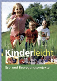
Kinderleicht Ess- und Bewegungsprojekte Für Kinder von 3 bis 12 Jahren

Die vorgestellten Projekte können an die eigenen Verhältnisse angepasst oder ergänzt werden. Dazu können und sollen auch Kinder und Eltern aktiv beteiligt werden. Das Buch enthält viele Hintergrundinformationen, die farblich gekennzeichnet sind mit Kästen, Tipps und Beispielen. Essen und Bewegen fördern soziales miteinander. Bewegung ermöglicht gemeinsame körperliche Erfahrung und Rücksichtnahme.