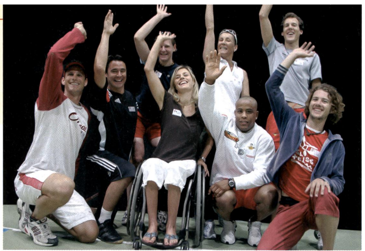
Les champions se mobilisent pour l'école bouge. Pour le plus grand plaisir des élèves.