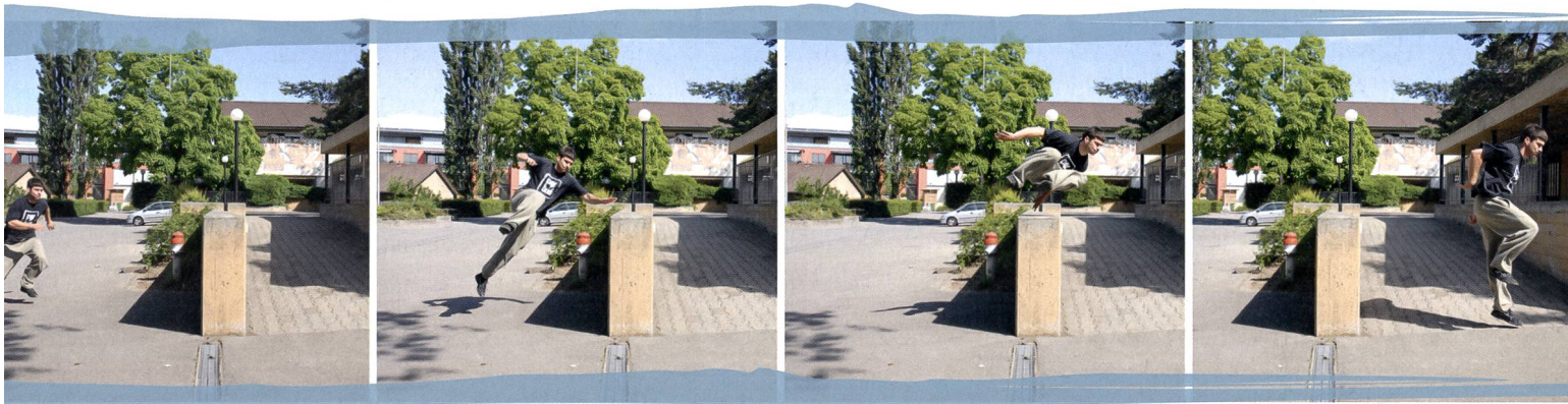
Lors d'un passément rapide, le traceur franchit rapidement un obstacle d'une hauteur de hanches/poitrine.

«mobile» publiera au cours de l'année 2010 un cahier pratique présentant les divers moyens de pratiquer le Parkour à l'école ou dans un club.