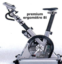
premium ergomètre 8i