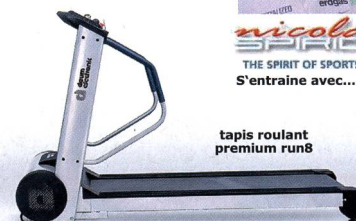
tapis roulant premium run8