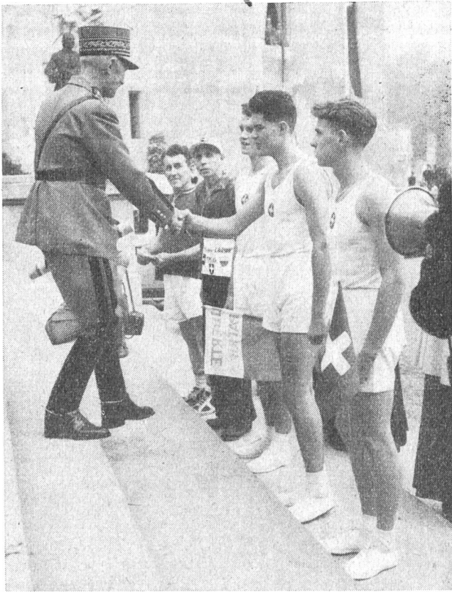
Il gen. Guisan ringrazia la gioventù svizzera per i graditi auguri

sanna e Ginevra e dell'Unione ticinese di Berna, e soprattutto il messaggio della gioventù svizzera che tre baldi giovani dell'I. P. gli hanno consegnato sulla piazza del Castello a Losanna. Centodieci giovani, ripartiti sugli altrettanti chilometri che separano Macolin da Losanna, si sono passati il messaggio scritto su una bella pergamena: dovunque la folla li ha applauditi, manifestando così il suo profondo attaccamento al Generale ed anche la sua simpatia per il movimento dell'istruzione preparatoria volontaria e per l'istituzione di Macolin, che oramai è diventata il centro di tutta l'attività sportiva di base del nostro paese.