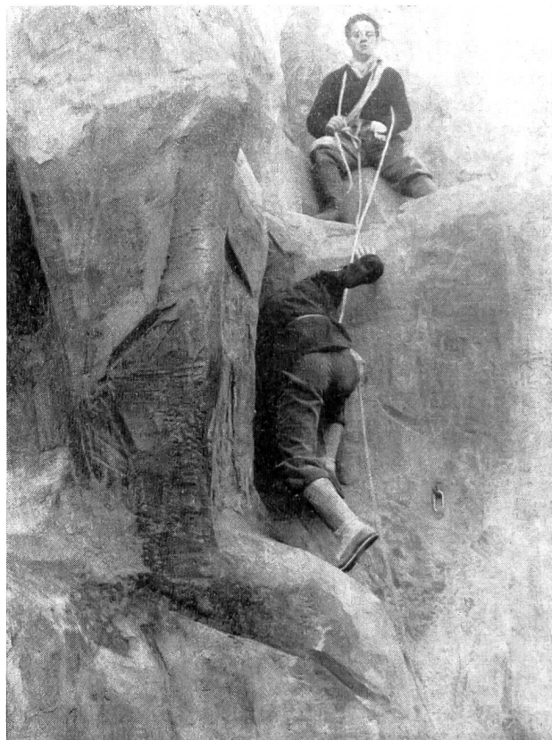
Il gruppo ticinese all'assalto della roccia artificiale

Riteniamo che incontri fra rappresentanti dei cantoni abbiano a essere rinnovati ogni anno: nella suggestiva e simpatica cornice di Macolin il motivo della giornata del 28 maggio all'HYSPA potrebbe essere ripetuto con le immancabili modifiche che si impongono per un'organizzazione così impegnativa che però potrebbe essere semplificata. Sarà bene parlare di ciò in una prossima riunione fra i dirigenti dell' I. P. (a. s.)