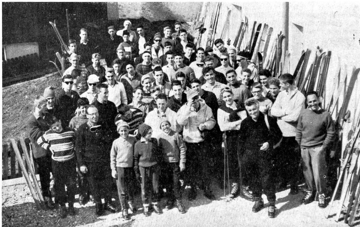
Il folto e allegro gruppo dei ticinesi partecipanti al corso cantonale di sci dell'I.P. a Mürren

«... Salir, sempre salir — ripete il vento — solo ardimento il tuo motto sarà...!» Fiorenzo Molinari