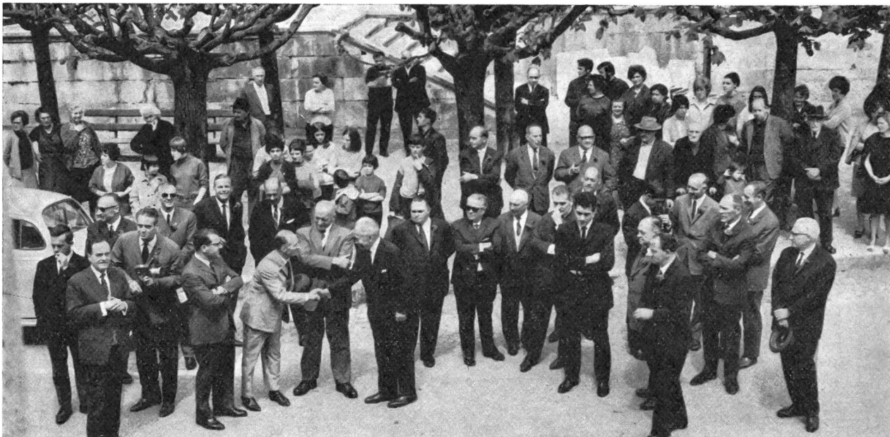
Aria di festa davanti al Municipio di St. Ursanne mentre suona la banda e si scambiano allegri e cordiali saluti