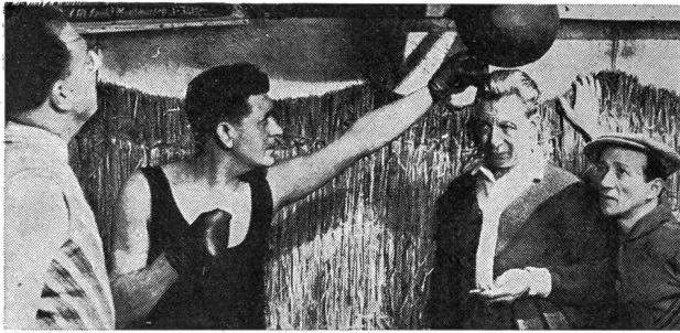
«Un soir de rafle». Louis Georget (interpretato da Albert Préjean) s'alena sotto la direzione di Charley Stick (interpretato da Constant Rémy), mentre il Baron des Haudriettes (Lucien Baroux), sulla sinistra, lo sta ammirando.

Nel gennaio 1933, sugli schermi francesi venne proiettato il film « Un soir de rafle », il cui eroe era Albert Préjean. Questo giovane primo-attore praticava allora la boxe. Aveva perfezionato il suo stile, allenandosi con Georges Charpentier, vedetta del film « Toboggan », di poco anteriore, nel quale, evidentemente, il campione era un pugile. Ma non si crea un film, disponendo solo della vedetta adatta, fos-