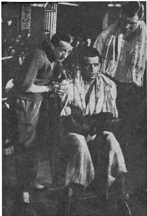
«Un buon film — Un soir de raffle —».

« The Fighting Heart » di John Ford (1925) venne proiettato in Francia con il titolo: « Il Campione » (con G. O'Brien e B. Dore); in seguito (1928) apparve « The Ring » d'Alfred Hitchcock.