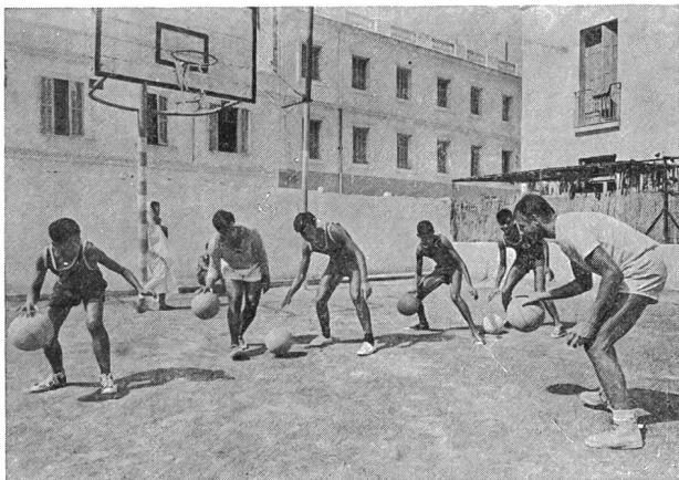
L'autore di questo articolo sta spiegando ad alcuni giovani tunisini i segreti del palleggio.

Viste le esperienze fatte con la gioventù nei principali giochi sportivi (calcio, pallacanestro, pallavolo, disco su ghiaccio, ecc.) nelle varie parti del mondo, si tratta di giovani in età fra i 10 ed i 14 anni; tralascio quindi certi gruppi sperimentali (pallacanestro e calcio) con ragazzi di 8 anni, intendendo infatti valorizzare soltanto le esperienze riscontrate nella mia qualità di allenatore della società Slavia-Praga, nel periodo dal 1960 al 1965, specialmente nei settori della pallacanestro e della pallavolo.