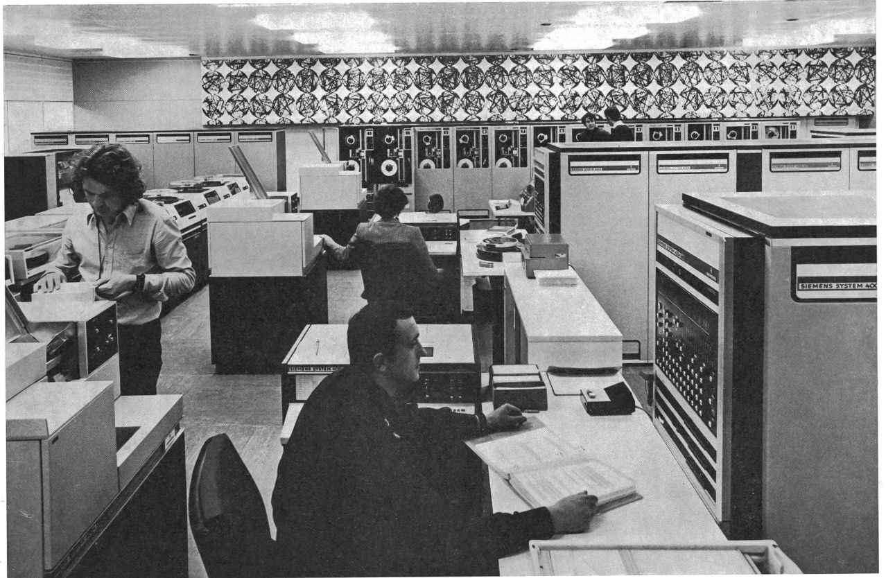
Il calcolatore olimpico. Durante i Giochi, sono giunti a questo centro di calcolo tutti i dati relativi a tutte le competizioni, che si sono svolte in 31 luoghi diversi. Il calcolatore ha ordinato questi dati in brevissimo tempo, per ritrasmetterli, mediante telescriventi, a tutti i centri-stampa dislocati tra Monaco e Kiel. L'elaboratore non ha trasmesso automaticamente solo il piazzamento dei concorrenti, ma ha anche segnalato la qualificazione eventuale degli atleti per la prova successiva, preparato un grafico per gli accoppiamenti negli incontri di pugilato, judo, lotta, scherma, ecc., ed emesso un segnale speciale ogni volta che è stato stabilito un nuovo primato olimpico o mondiale.