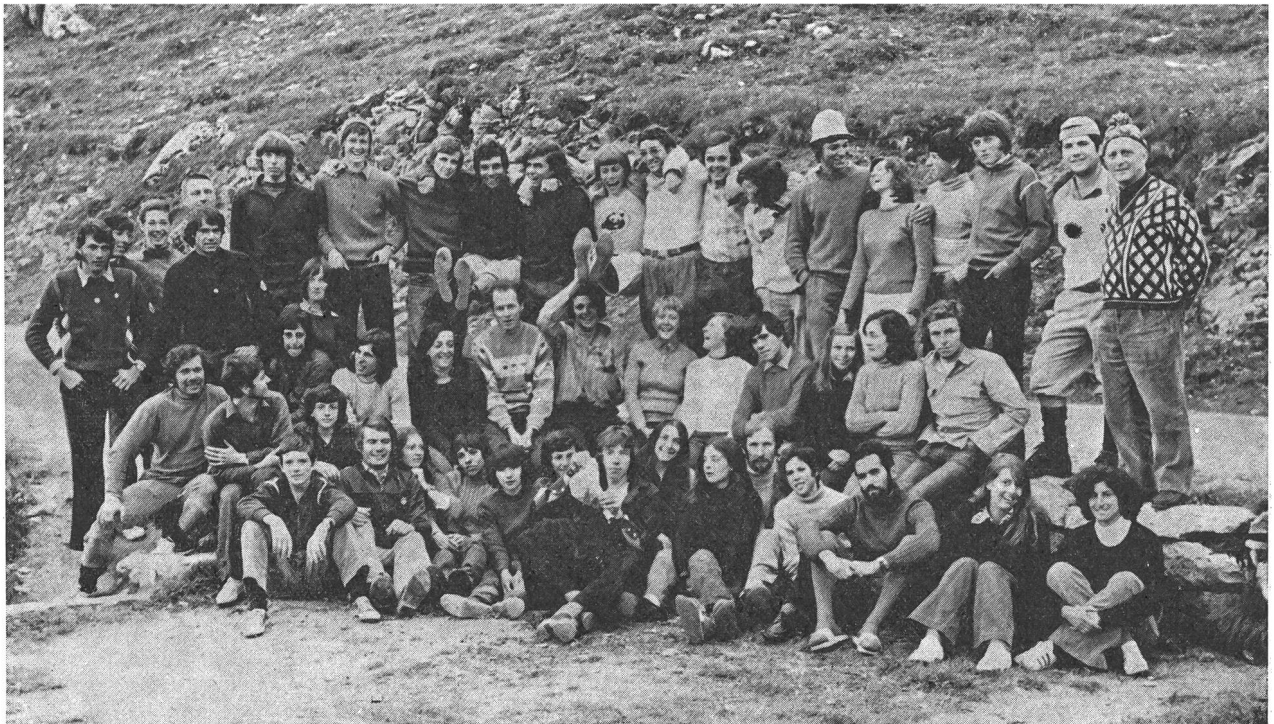
Felicità di dirigenti, istruttori e partecipanti a conclusione di un nuovo corso cantonale di alpinismo conclusosi in bellezza, malgrado le avverse condizioni atmosferiche, e una volta di più senza incidenti

grandine neve e via discorrendo nella nebbia, tutta produzione sua, a quanto si dice) che s'è invitato anche al corso cantonale di alpinismo al Furka organizzato per 40 giovani: 28 ragazzi e 12 ragazze provenienti dal Ticino, dal Grigioni (Valle Mesolcina), un giovane addirittura da Los Angeles, un altro di nazionalità italiana (il movimento «Gioventù e Sport» è aperto a tutti i giovani), ma vietato ai disturbatori come lui, il divo Pluvio! Logico che gli sia stata preclusa l'entrata al «Fort Galenhütte» (m 2407), l'accoglientissima sede messa a disposizione dell'autorità militare con tutte le sue attrezzature: e il maltempo, subito mobilitato dall'indispettito re-saetta, si è scatenato a intervalli pressochè regolari (anche la neve è scesa, inutilmente ammonitrice, ben tre volte!) tentando l'ignobile... sabotaggio e soprattutto cercando di penetrare nella mente e nel cuore dei giovani alpinisti per scoraggiarli o almeno immunarli; il sabotaggio è fallito in partenza per l'ormai tradizionale sicurezza offerta da una preparazione accurata e consona alle esigenze del caso che non bada a sacrifici