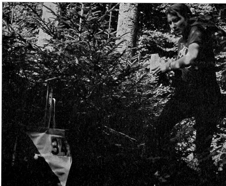
Con sicurezza questa partecipante entra nella zona del posto, un ultimo sguardo alla carta e alla descrizione del posto e già si trova davanti alla lanterna, la carta di controllo vien forata e già è scomparsa...