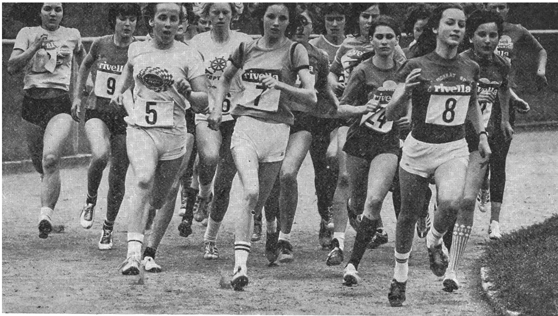
Decise a tutto, le ragazze si lanciano sui mille metri. Un esempio di coraggio e di volontà di imitare.