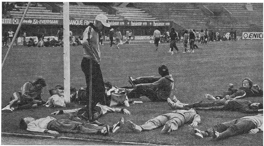
Un aspetto molto simpatico delle giornate dello sport scolastico è il lavoro di squadra. Ogni monitore prepara accuratamente i suoi protetti alla competizione, in questo caso con esercizi di rilassamento alternati a test di reazione.