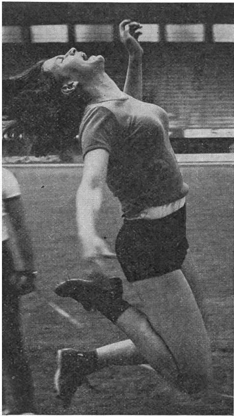
Ci sono gare appassionanti. Le ragazze per nulla inferiori ai ragazzi, come lo documenta questo energico salto che riflette la mobilitazione delle ultime riserve.