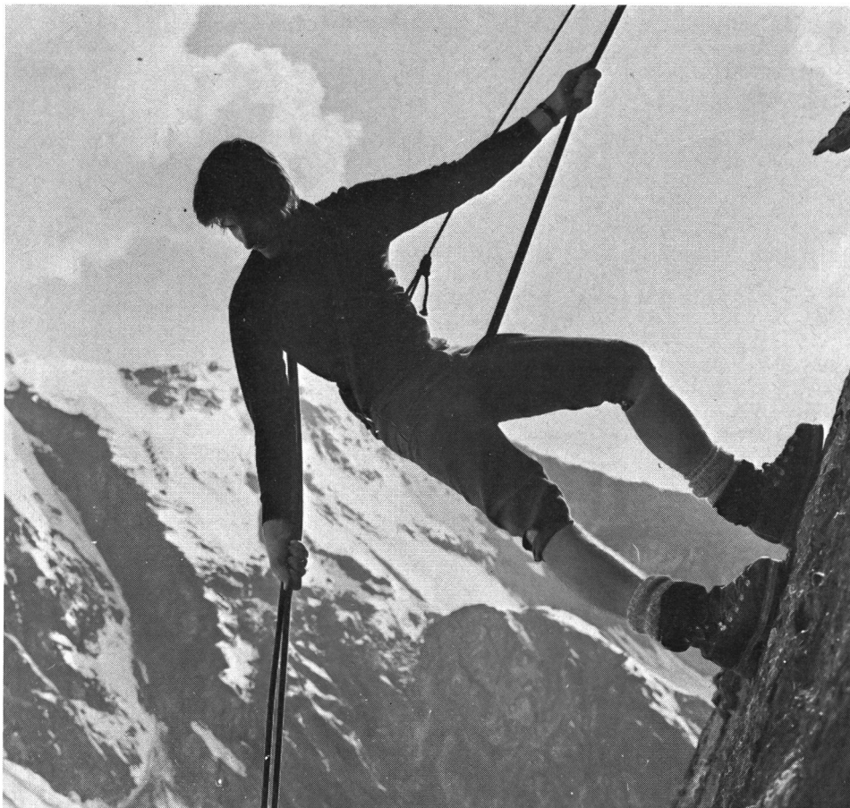
L'istante in cui ogni gesto impegna la sorte di tutti. La corda: un legame che simbolizza la sicurezza e che permette di vivere «la vertigine delle profonde distanze».

Altrimenti detto una amara pillola deve essere ingoiata per gli iniziatori dell'idea di G+S. Questo piano nel campo delle restrizioni è il secondo e fa seguito a quello preso nel 1975; a giusta ragione è considerato inquietante per diverse ragioni.