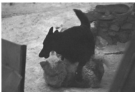
Una cagna adulta ne sottomette un'altra dopo una furiosa lotta gerarchica. Si noti la similarità delle posture rispetto alle foto precedente.

Eibl-Eibesfeldt azzarda l'idea che «l'impulso ad apprendere, che sta alla base della curiosità, unito ad un forte eccesso motorio, basti a spiegare il gioco». I termini particolari di quest'asserzione si