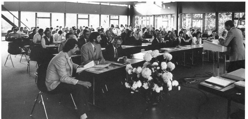
Un momento dei lavori della doppia conferenza autunnale dei capi degli Uffici cantonali G + S e dei delegati G + S delle federazioni sportive nazionali.

re in modo particolare per il grande appoggio e impulso che ha dato per la realizzazione di quel gioiello che sorgerà al Centro sportivo di Tenero a favore della gioventù tutta».