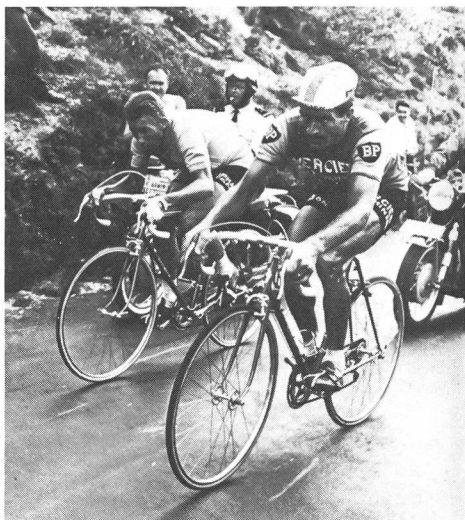
Una delle più belle pagine dell'epopea ciclista: il terribile gomito a gomito di Jacques Anquetil e Raymond Poulidor sul Puy-de-Dôme, al Giro di Francia del 1964.

Al contrario la (molto relativa) vulnerabilità di Poulidor, molto più morale e mentale che propriamente atletica, gli attirava l'incredibile favore del pubblico: quest'ultimo infatti si riconosceva in lui.