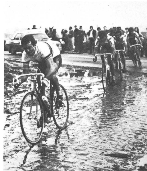
Bernard Hinault vincitore della Parigi-Roubaix del 1981: una corsa... infernale.

Ora è innegabile che taluni aspetti nascondono a questo riguardo dei pericoli troppo facili da enumerare: esasperazione della violenza o dell'aggressività collettiva, irresponsabilità dei tifosi dovuta al «transfer» che si opera, facendo dello sport il cosiddetto « oppio dei