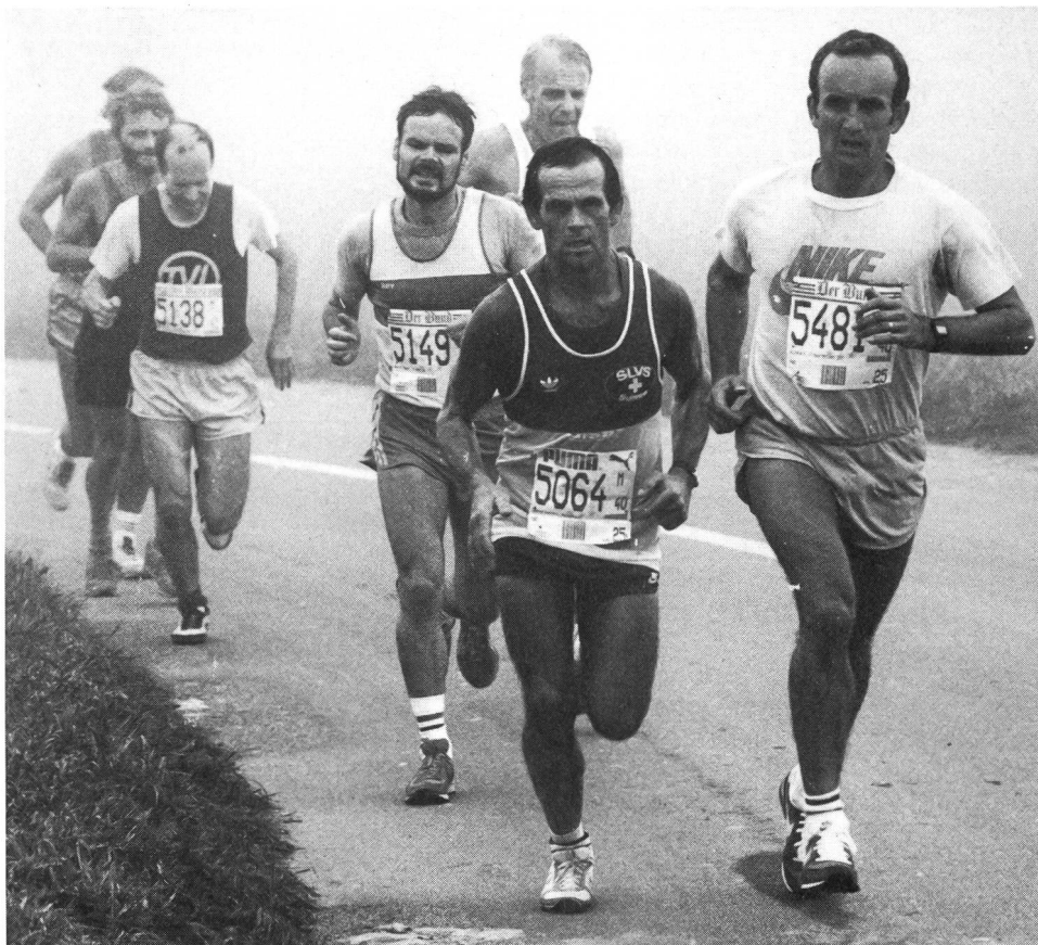
Qualità o quantità?

La risoluzione del quesito, che pure costituisce un aspetto fondamentale della struttura di ogni allenamento, non è contenuta nei libri: quelli che trattano i principi teorici dell'allenamento («Trainingslehre» per i germanofoni) non si occupano che superficialmente del problema. L'analisi delle opere principali conferma questa affermazione: fra gli autori più noti cito Harre 1 che ignora totalmente la questione, imitato da Weineck, suo successore spirituale. I ragionamenti di quest'ultimo rimangono prigionieri di concetti semantici artificiali e inefficaci, ripresi alla rinfusa dal predecessore. Solo nel paragrafo «Allenamento igienico» (sic) si azzarda ad affermare: «la frequenza dell'allenamento ha più effetto che la durata sulla