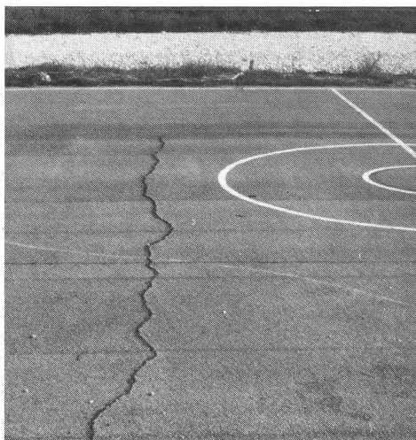
Fessure mal viste sui terreni sintetici

Nei due anni seguenti la costruzione, i difetti devono essere annunciati immediatamente dopo la loro scoperta. Se ve ne sono parecchi, e che non hanno conseguenze spiacevoli, si può aspettare la fine del termine di 2 anni per annunciarli in blocco. Quanto ai difetti nascosti, forse rilevabili dopo 3 anni o più, essi devono essere immediatamente annunciati e separatamente. Bisogna mostrare prudenza nei casi di garanzie di oltre 10 anni. Contengono generalmente una clausola di durata di vita, ciò significa che un difetto riscontrato solo dopo 9 anni, le prestazioni di riparazione (sostituzione) non supera il 10%.