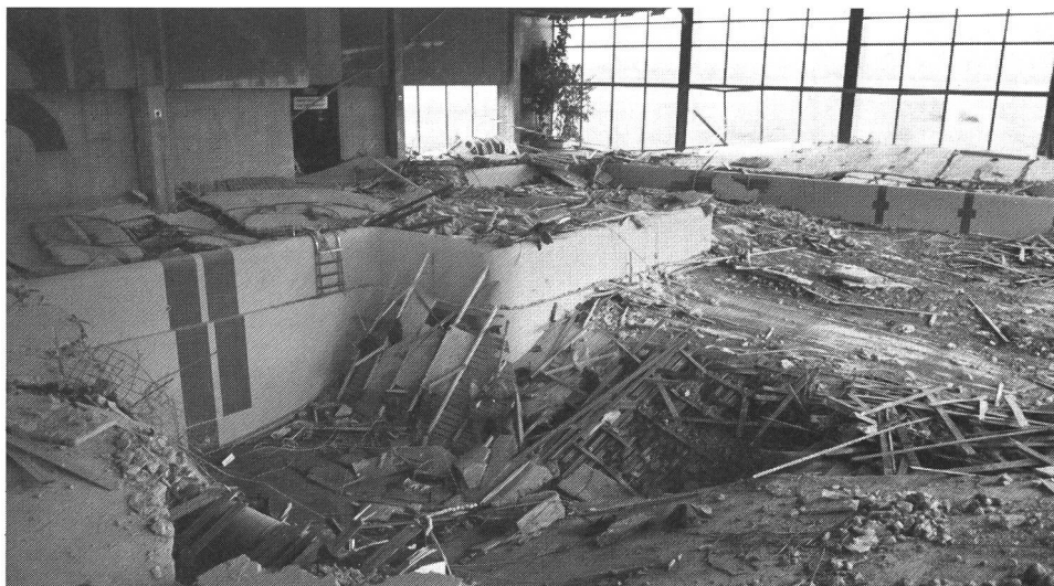
Danni ingenti e tragedia umana: il 9 maggio 1985 crolla il tetto interno della piscina di Horgen.