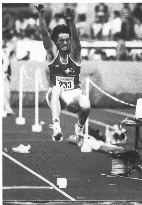
Molto più facile saltare in assenza di gravità.

Il torace sarà più corto. A seguito dell'accumulo di liquidi nella gabbia toracica, diminuirà la capacità vitale e la respirazione diventerà più superficiale. Il cuore sarà più piccolo, al contrario di quello che succede negli atleti, in quanto le fibre muscolari che lo compongono