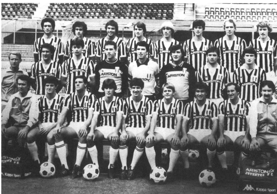
La Juventus di Torino, sotto la guida di Trapattoni e del dott. La Neve, è stata una delle prime squadre italiane a introdurre un rigido controllo dell'alimentazione dei suoi giocatori.

Messaci quindi la coscienza in pace, e già preparati a sentire il coro di quelli che diranno « ai miei tempi si faceva così e così, birra e salsiccia con i crauti negli spogliatoi, eppure siamo diventati campioni », proviamo ad entrare nel vivo dell'argomento. Come insegnano gli inglesi, una buona esposizione deve rispondere alle seguenti domande: Who? When? What? Where? Why?