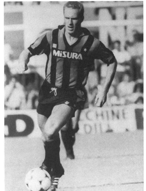
Karl-Heinz Rummenigge ai tempi dell'Inter. La sua prima colazione, secondo l'uso tedesco, è a base di uova e pancetta. Molti calciatori italiani, nella speranza di emularne le gesta, adottarono le stesse abitudini alimentari.

Anche la frutta andrebbe consumata lontano dai pasti principali, a metà mattina o metà pomeriggio, per evitare fenomeni di fermentazione. In ogni caso si terrà conto dei gusti soggettivi e di eventuali intolleranze (per esempio al succo di arancia che in taluni provoca acidità). Con alle spalle una buona prima colazione, il pasto del mezzogiorno assume una importanza minore. Se leggero permetterà ai calciatori di arrivare alla partita o all'allenamento con la digestione già terminata.