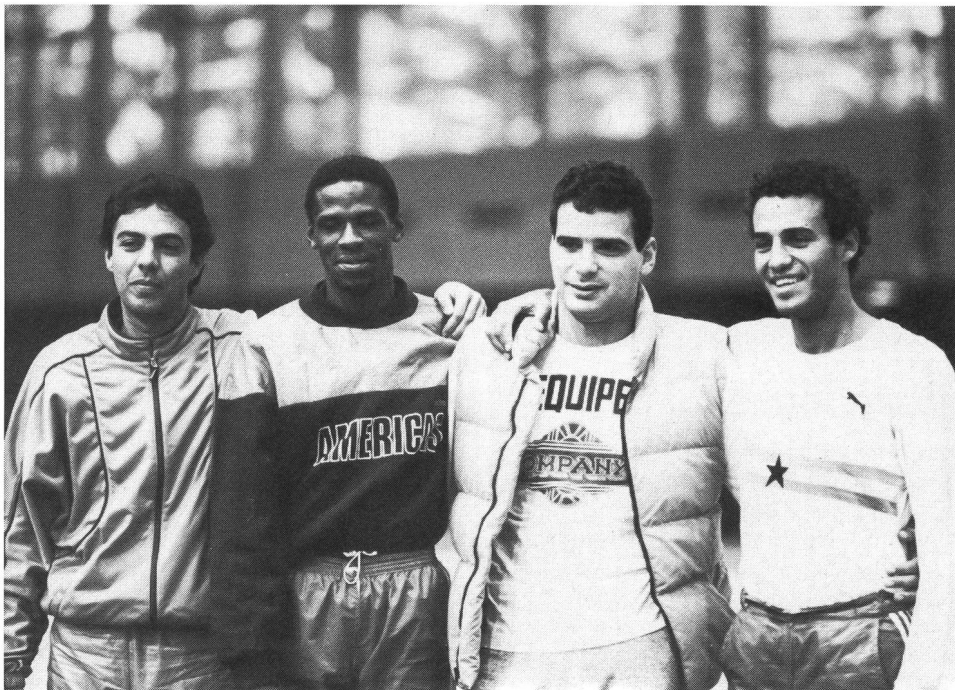
Presenti ai grandi meeting, gli amici brasiliani si preparano anche a Macolin (inverno '87; foto di Y. Jeannotat).

Una breve visitia allo stadio per respira-