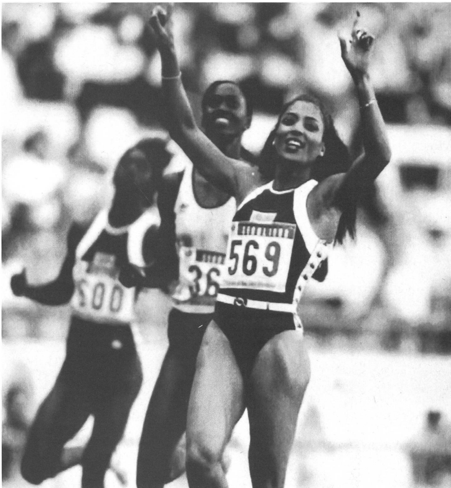
Sport e femminilità, un felice connubio. Nella foto: il sorriso di Florence Griffith al traguardo della finale dei 200 metri a Seul. Alle sue spalle la giamaicana Grace Jackson.

Per finire il rischio di prolasso uterino dovuto a ginnastica intensa, a salti o a traumi è minimo. Se un prolasso si verifica le cause vanno ricercate altrove e trattate chirurgicamente, ma sicuramente lo sport non ne è il responsabile.