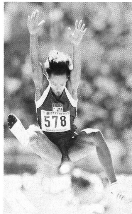
Nessuna controindicazione a praticare lo sport durante il ciclo mestruale.

La non comparsa delle prime mestruazioni, il cosiddetto menarca , all'età della pubertà è il primo problema che molte giovanissime si trovano a dover affrontare. Praticare intensamente uno sport può essere causa di una amenorrea primaria? Studi estesi sull'argomento non hanno portato a sicure conclusioni. Nelle adolescenti degli Stati Uniti, ad esempio, il primo flusso mestruale compare tra i 12,2 ed i 12,6 anni. Nei gruppi di ragazze che praticano sport in maniera intensa le prime regole appaiono molto più tardi. Molto dipende anche dal tipo di sport praticato; per esempio nelle pallavoliste l'età media di comparsa del menarca è di 14 anni, per chi corre ancora più tardi, mentre le nuotatrici sono più precoci delle ginnaste. Una re-