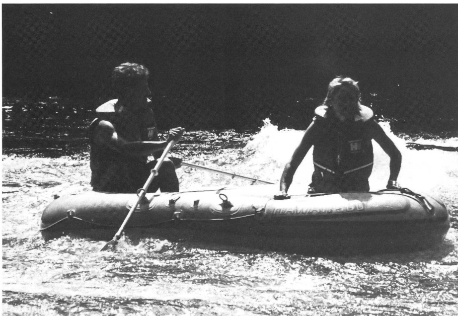
Grazie ai giubbotti di salvataggio anche chi non sa nuotare o nuota male può divertirsi sul gommoni.

si fidano, in acque profonde, di accessori gonfiabili; ... se si tolgono o si gioca con mezzi di salvataggio (salvagente, aste ecc.); ... se «capitani di gommoni» temerari scelgono percorsi fluviali che non hanno esplorato in precedenza; ... se si legano i gommoni uno all'altro rendendoli praticamente ingovernabili; ... se bambini, persone che non sanno o sanno nuotare male occupano un gommoni senza usare il giubbotto di salvataggio; ... se a causa del consumo di alcolici non si è più consapevoli dei propri limiti negli sport acquatici.