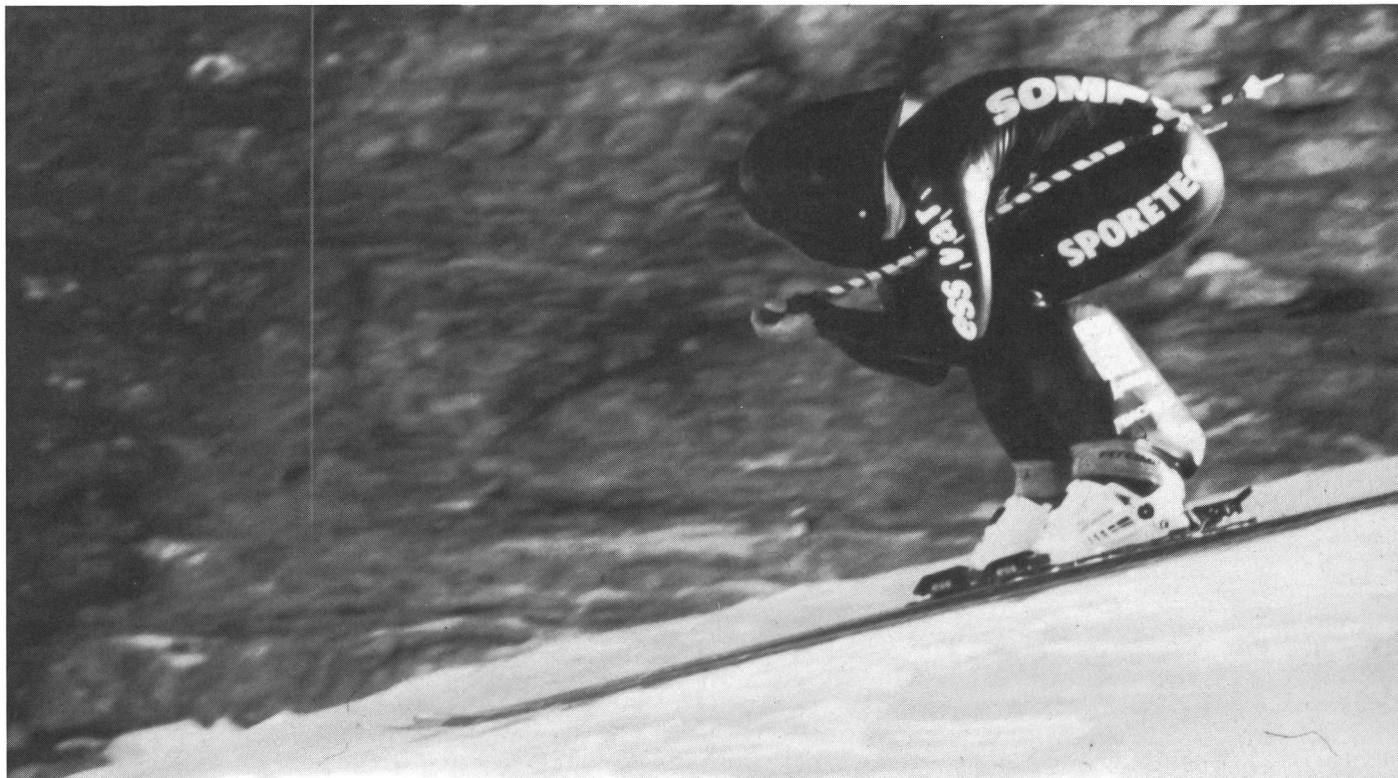
L'immagine non riflette esattamente la pendenza, ma offre le caratteristiche aerodinamiche dell'equipaggiamento.