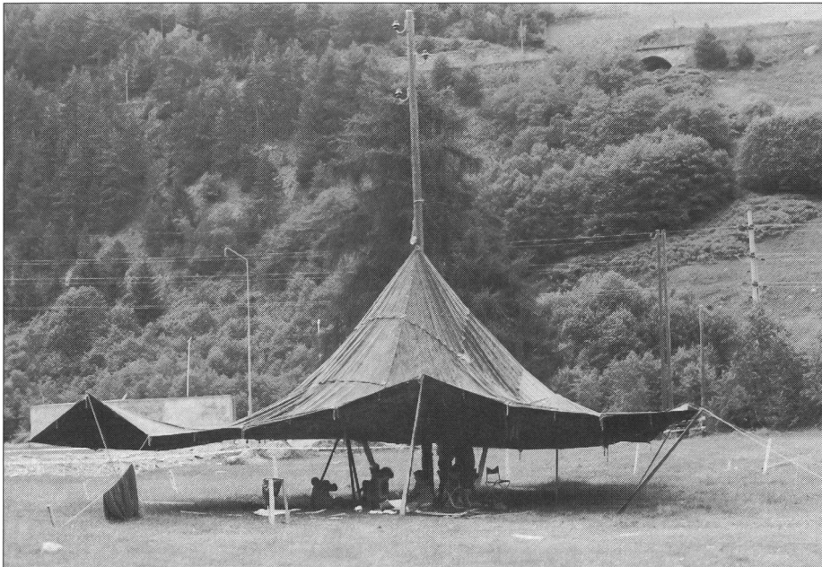
Incredibile ma vero: una tenda fissata a un palo per la conduzione della corrente elettrica!