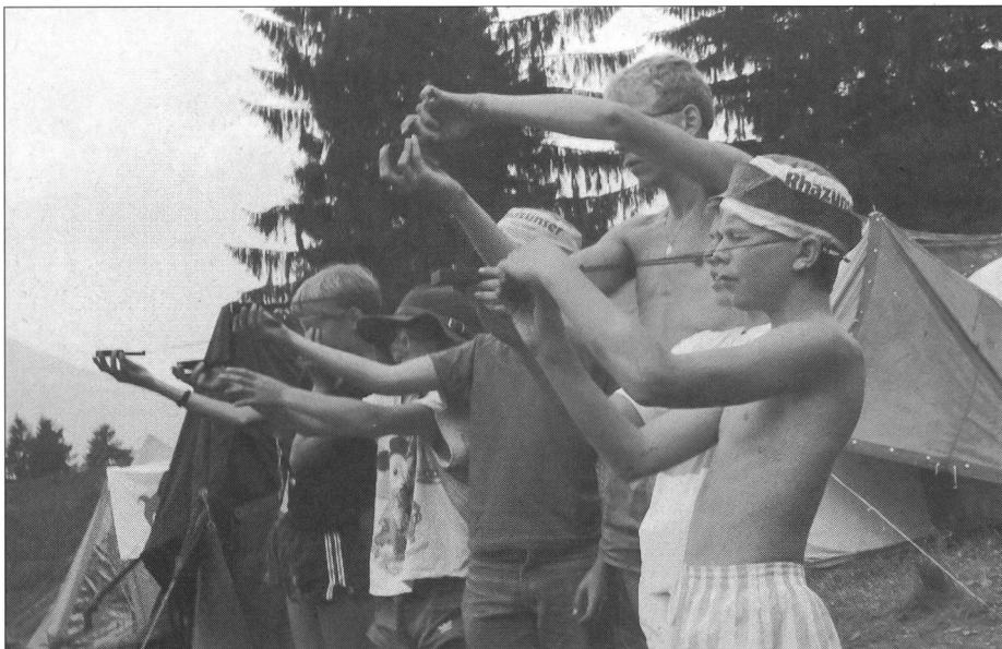
La regione del campo può essere scoperta grazie a esercizi di orientamento.

Le conseguenze di questi esempi negativi non sono solamente infortuni a persone e danni al paesaggio ma bensì soprattutto l'abuso della fiducia e la diminuzione della reputazione del campo. Chi conosce la realtà e i problemi di un campo svolto in una regione di montagna, sa che con la fiducia si può ottenere molto di più: ad esempio, il permesso di installare il campo su un terreno perfetto che non ha uguali sulla terra. Il monitore responsabilizzato non deve impartire ai par-