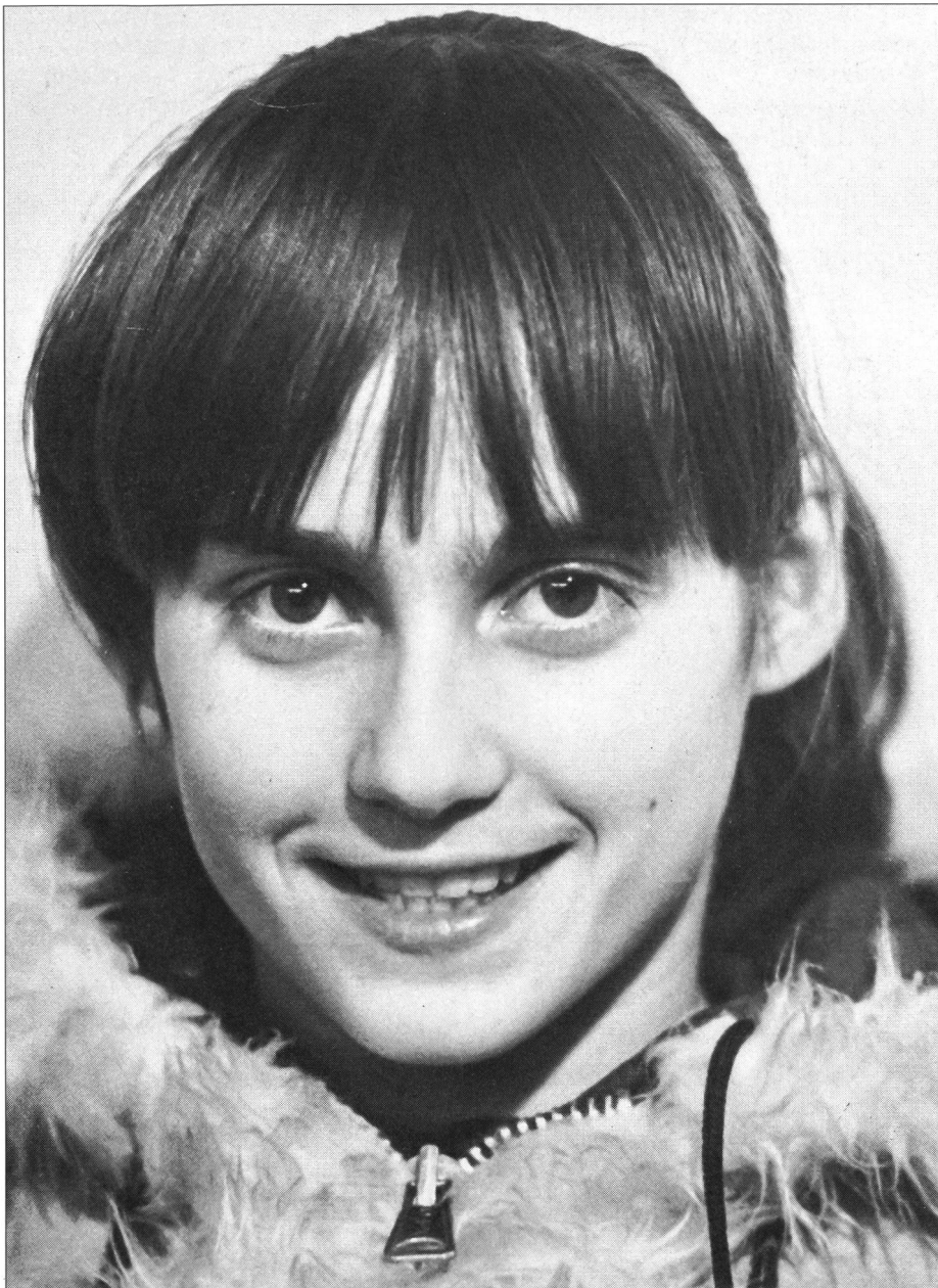
Nadia Comaneci all'età di 14 anni.

tecnica. Quando ci trovavamo all'estero e, ad esempio in un hôtel, eravamo confrontati con un apparecchio sconosciuto senza sapere come utilizzarlo, tutti chiedevamo soccorso alla campionessa: «Nadia, come funziona?» E lei, senza esitare, girava il giusto bottone ed accendeva o spegneva l'apparecchio sconosciuto.