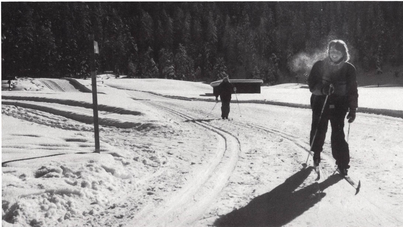
Un sorriso prima d'affrontare l'impegnativa (e a volte rovinosa) discesa dello Stazerwald.