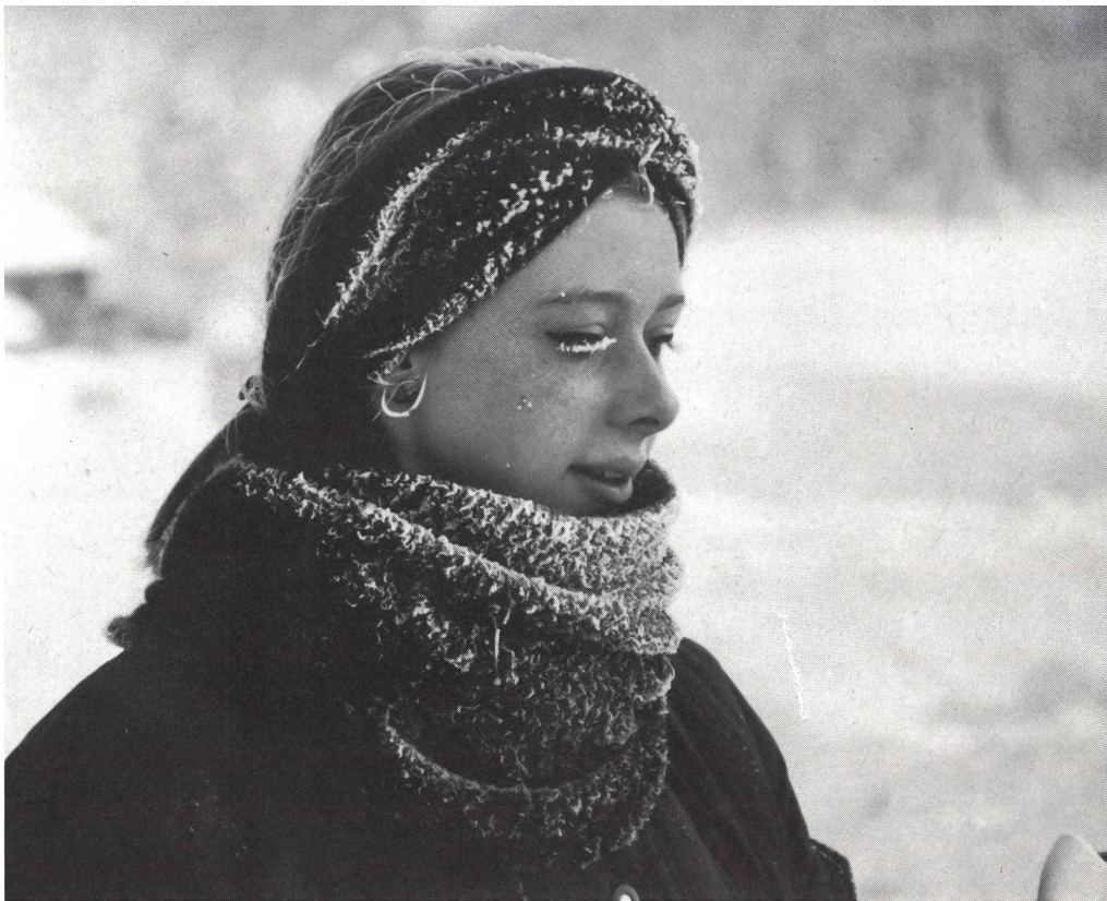
Vivere l'inverno: aria ghiacciata sui vestiti e sui capelli.

Un campo come quello organizzato in Engadina dalla magistrale di Muristalden ricerca finalità ed intenzioni più ampie: ogni allievo deve poter vivere il maggior numero di esperienze nelle discipline invernali. Egli deve aver la possibilità di provare movimenti sconosciuti, di riconoscere i presupposti necessari per poter, in seguito, vivere il movimento in modo ottimale.