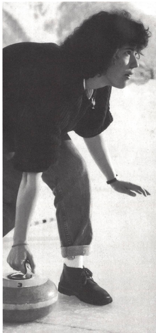
Concentrazione: una facoltà richiesta nel curling.

La vigilia, Beat Hofmänner ha rivolto parole incoraggianti e motivanti ai partecipanti più timorosi: «Avrete la possibilità di scoprire i vostri corpi, la vostra respirazione, il paesaggio incantevole, la calma dell'inverno. Solamente dopo una prestazione di questo tipo potrete gustare pienamente il rilassamento e la fase di ricupero successiva...» ■