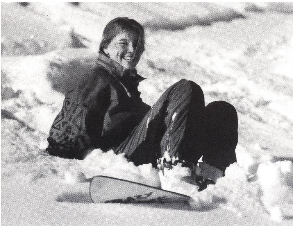
Sembra facile: balletto con lo Snowboard.

Scanf, 14 gennaio 1991. 50 seminaristi e futuri maestri di scuola elementare del Canton Berna iniziano una settimana polisportiva con un programma assai intenso che comprende lo sci di fondo come disciplina centrale ed altri 6 sport tipicamente invernali.