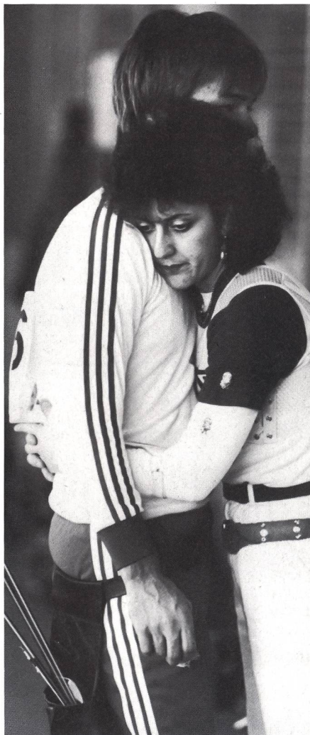
Assistere significa anche consolare ...

Dal punto di vista della psicologia sociale, l'assistenza mira alla creazione di un ambiente di gruppo (squadra) armonioso, che soddisfa i bisogni sociali ed emozionali di ogni singolo atleta, tenendo conto anche degli interessi e delle attività extrasportive.