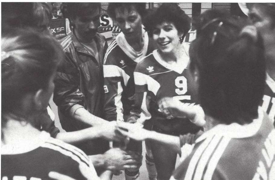
... motivare durante la competizione

L'assistenza è un metodo di conduzione e di guida - ben definito a livello istituzionale ed organizzativo - con una base psicologica ed - uno spiccato orientamento pedagogico