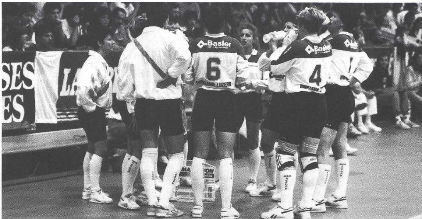
Assistere significa consigliare e ...

l'ambiente di gara (vitto, alloggio, spostamenti), l'assistenza nel periodo di pre-gara, le informazioni durante la competizione, l'assistenza psicologica in caso di sconfitta.