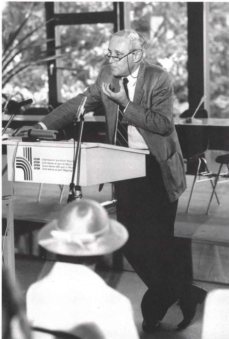
Lo sport assume un significato esistenziale.

Il sistema scolastico svizzero ha tenuto conto delle loro considerazioni e i cantoni hanno dato una crescente importanza all'insegnamento dello sport nelle scuole. Lo sport è la sola materia scolastica sottoposta al diritto federale, il quale determina il numero minimo di ore d'insegnamento