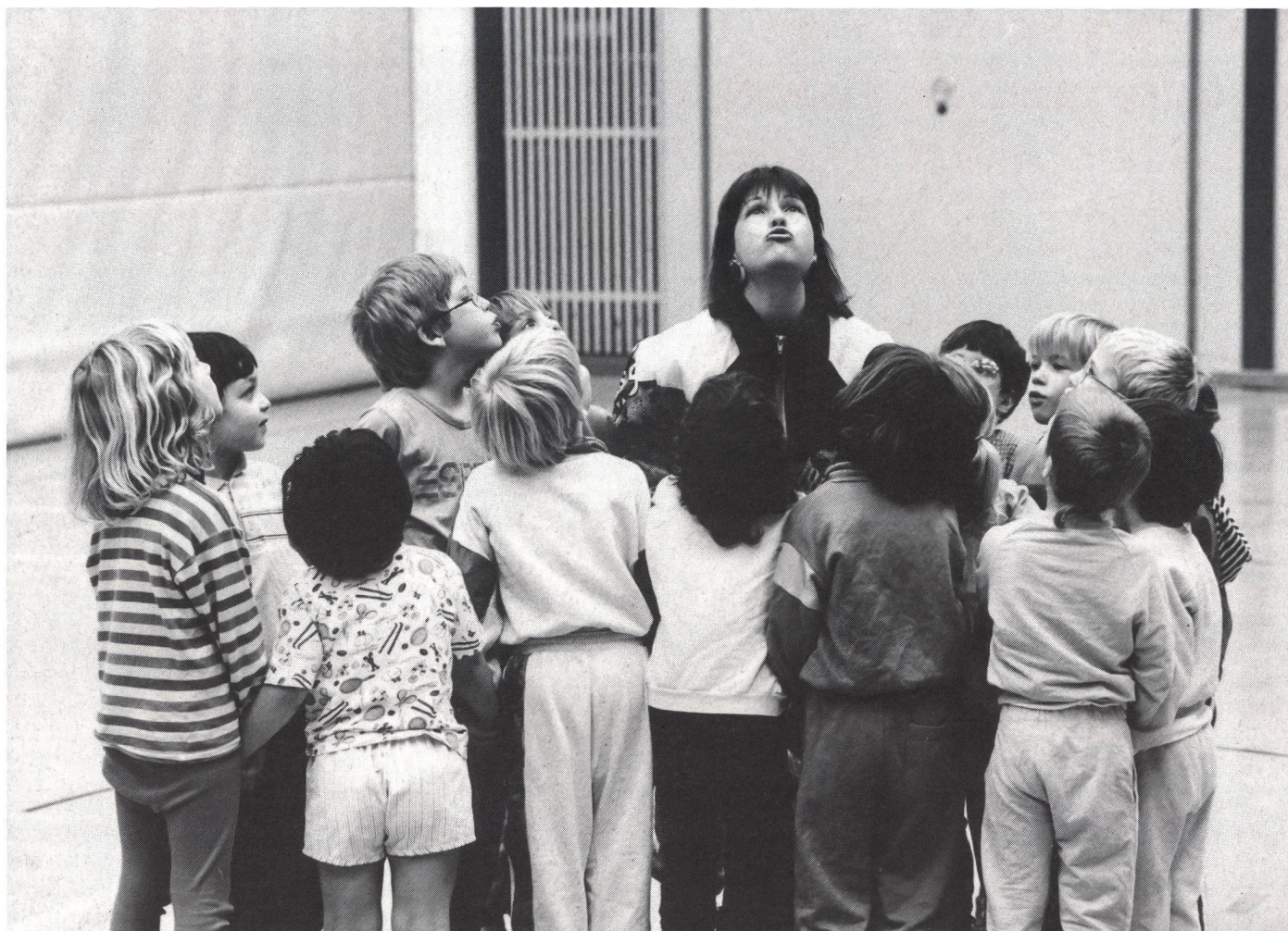
L'insegnamento dell'educazione fisica è fondamentale per lo sviluppo psicofisico dell'allievo.

materiali che affittiamo, sulle proposte a venire, ma abbiamo bisogno di un costante contatto coi soci. Questo può avvenire in modi diversi, anche semplicemente con una critica costruttiva, con una richiesta di informazioni, con la partecipazione alle riunioni mensili di Comitato che sono aperte a tutti e che si svolgono nella sede sociale, messa gentilmente a disposizione dal comune di Pregassona.