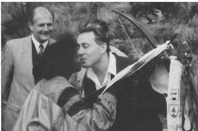
Ad Anima (Gibuti) il compito di consegnare la simbolica balestra della staffetta del 700° al sindaco di Indemini.