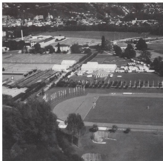
In volo sopra il campo olimpico per il trasporto della balestra della Staffetta del 700° da Tenero a Indemini.