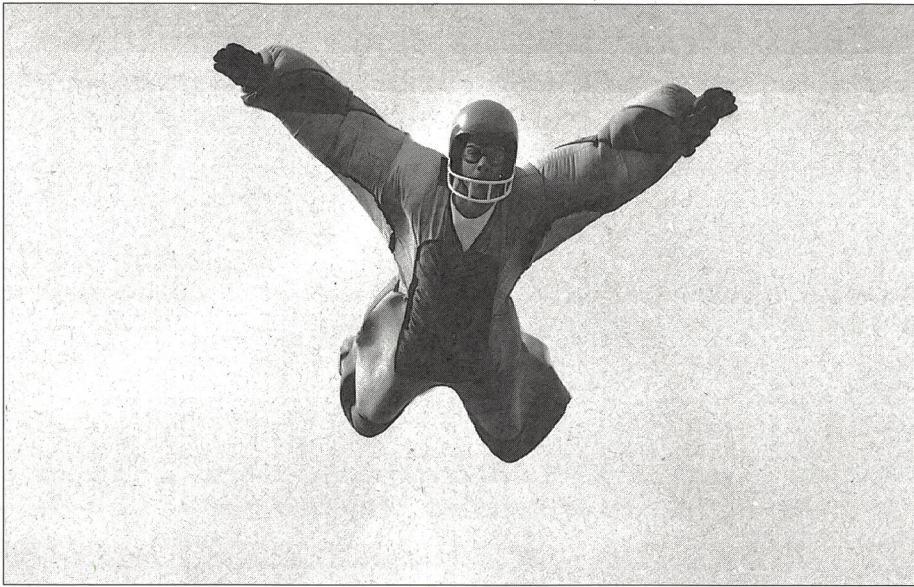
Voglia di tensioni e di eccitazioni in un mondo così monotono e noioso.

reagiscono in modi diversi a questa monotonia della loro vita quotidiana, alla mancanza di eccitazione e di avventura. Come dicono Becker e Schirp (1986): forme "devianti" di soluzione dei conflitti non si osservano soltanto nei giovani di una determinata subcultura o di una determinata classe sociale, ma anche, più in generale, a livello di adulti e di appartenenti alla classe media ed elevata. Questi gruppi sociali dispongono di maggiori risorse finanziarie e simboliche che fanno in modo che queste deviazioni non siano più così evidenti. Quello che per gli uni sono la discesa di torrenti impetuosi, lo sci estremo, il parapendio, il deltaplano, le scuole di sopravvivenza, i video porno, violenti o dell'orrore, il loro bordello per bene, per gli altri sono il surf sulla sovrappavata, divertirsi ad imbrattare i muri, o la loro vita quotidiana da hooligans. Il calcio per gli hooligans rappresenta solo il background o la base per la loro ricerca, la loro voglia di tensioni, e di eccitazioni in un mondo altrimenti così monotono e noioso, così privo di avvenimenti di rilievo.