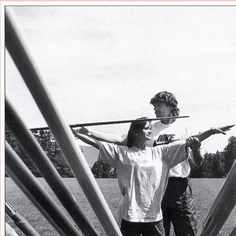
In copertina: Dirigere comporta grandi responsabilità, anche nello sport. Monitori e monitori dimostrano, spiegano, correggono: insomma, insegnano. Mostrano uno sport di qualità. Per un determinato periodo guidano un gruppo giovanile. Si occupano di molte cose: dal materiale al programma, dall'organizzazione degli allenamenti agli aspetti sociali della vita di gruppo.

Lecture 23 Nicola Bignasca La stanchezza della vista 24 Gennaro Palmisciano