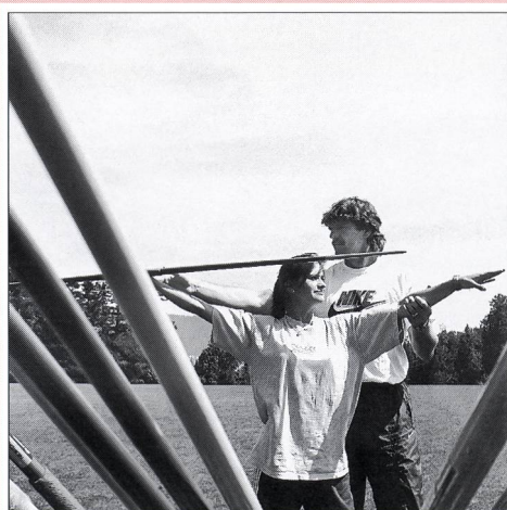
In copertina: Dirigere comporta grandi responsabilità, anche nello sport. Monitori e monitori dimostrano, spiegano, correggono: insomma, insegnano. Mostrano uno sport di qualità. Per un determinato periodo guidano un gruppo giovanile. Si occupano di molte cose: dal materiale al programma, dall'organizzazione degli allenamenti agli aspetti sociali della vita di gruppo.