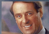
Adolf Ogi, consigliere federale

La formazione si rivolge all'essere umano considerato nel suo complesso. In questo ambito anche lo sport – nella scuola e al di fuori di essa – deve apportare il proprio contributo. Le decisioni prese oggi nella politica della formazione influenzeranno la qualità della vita delle generazioni future. In questo senso ritengo che la fusione di