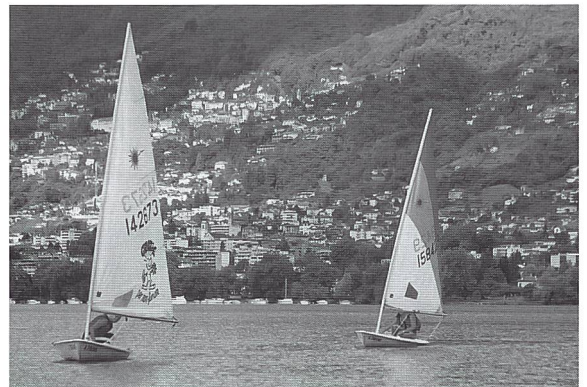
Sport acquatici presso il CST di Tenero.