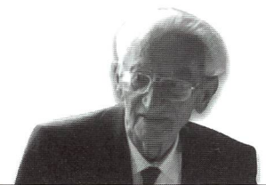
Edwin Burger, membro onorario dell'ASEF dal 1986, è deceduto lo scorso 16 gennaio 2001.

L'opera di Burger ha lasciato tracce in tutta la Svizzera; insieme al suo collega Andreas Krättli (1919 – 1999), docente ai corsi dell'ASEF, si è profilato come pioniere dell'educazione al movimento basata sull'estetica. Le sue idee profonde ed innovative hanno segnato la storia dell'educazione fisica, dal suo manuale di educazione fisica per ragazze del 1966, testo scolastico ufficiale in Svizzera, al più recente manuale di ginnastica con o senza piccoli attrezzi del 1980. m