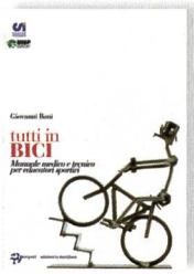
Boni, G. (2005). Tutti in bici. Manuale medico e tecnico per educatori sportivi. Molfetta, Edizioni la meridiana, 2005.