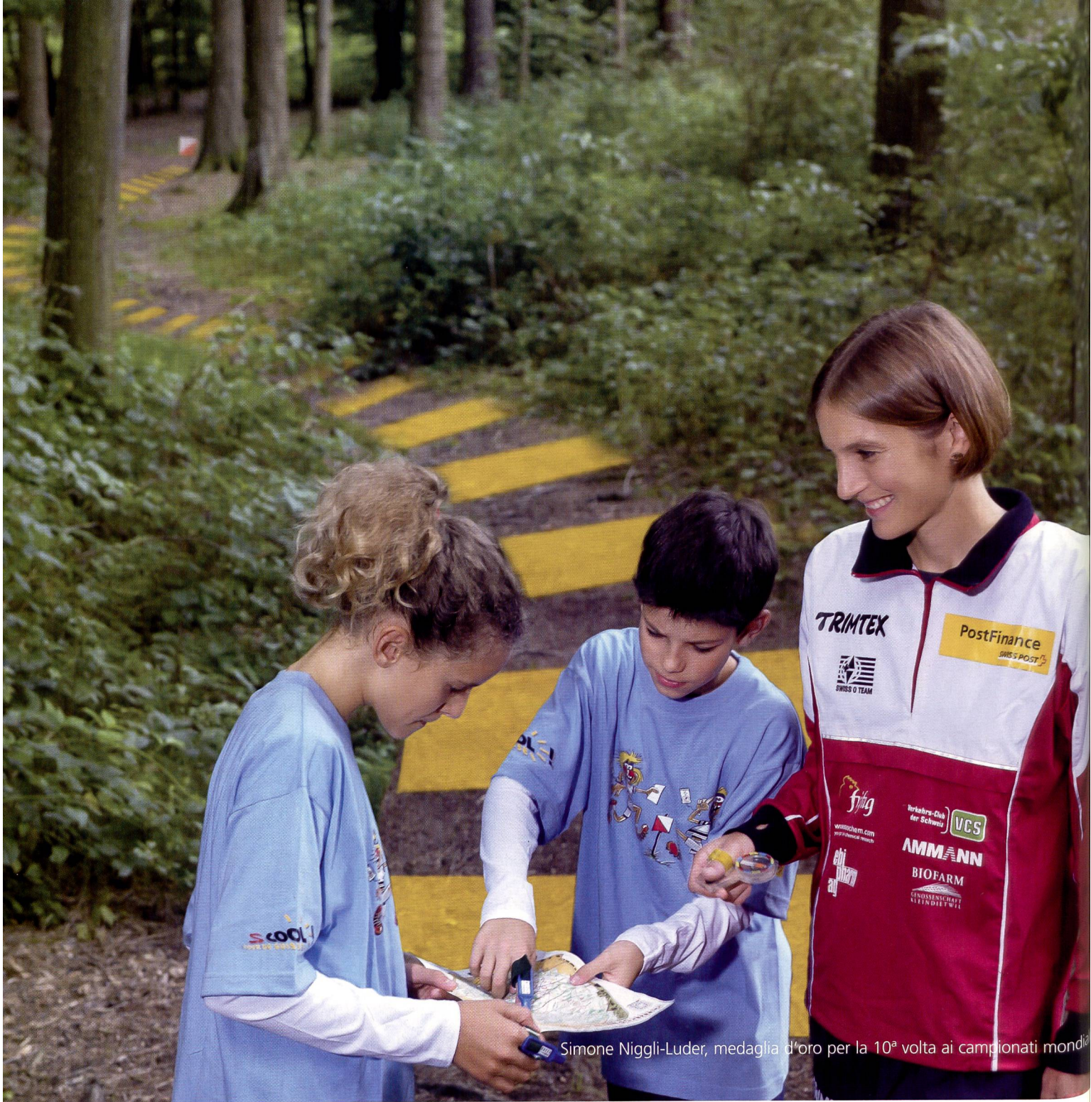
Simone Niggli-Luder, medaglia d'oro per la 10ª volta ai campionati mondiali