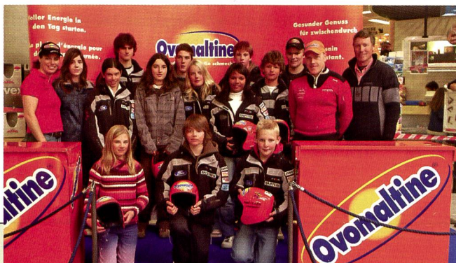
Foto di gruppo per i campioni in erba dello sci vallesano.

Da decenni Ovomaltine s'impegna a favore dello sport invernale e in particolare delle giovani leve. I leggendari Ovo Grand Prix sono stati il trampolino di lancio della carriera per numerosi sportivi d'élite e campioni dello sci come Erika Hess, Paul Accola, Mike von Grünigen, Didier Cuche, Sylviane Berthod, Nadia Styger o Pirmin Zurbriggen, il promotore del progetto «Scuola e sport sulla neve». //