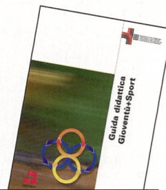
Guida didattica G+S

Il rapporto fra i diversi allenatori e la collaborazione con le atlete sono all'insegna della familiarità. La gerarchia viene vissuta in modo molto naturale e le relazioni sono impregnate di rispetto reciproco. Per i membri del gruppo, una simile atmosfera è indispensabile per consentire alle ragazze di fornire quotidianamente un impegno totale. L'intero processo di apprendimento viene strutturato in modo chiaro dall'allenatrice. Nella fase iniziale di ogni ciclo, le ragazze hanno la possibilità di partecipare attivamente al processo proponendo delle idee e, a volte, durante la creazione delle coreografie la Bürgi-Zhekova struttura e formula i compiti lasciando voce in capitolo anche alle ginnaste. Ma quando si tratta di elaborare la presentazione con le necessarie premesse legate alla prestazione e di gestirne l'esecuzione con sicurezza, l'allenatrice afferra le redini saldamente in mano diventando l'unica regista. //