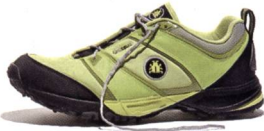
PYTHO BUGrip® Racing