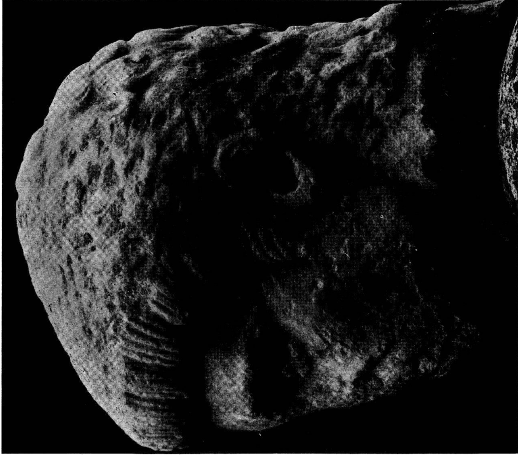
Tafel 3. Constantius II. als Caesar (?), Istanbul.