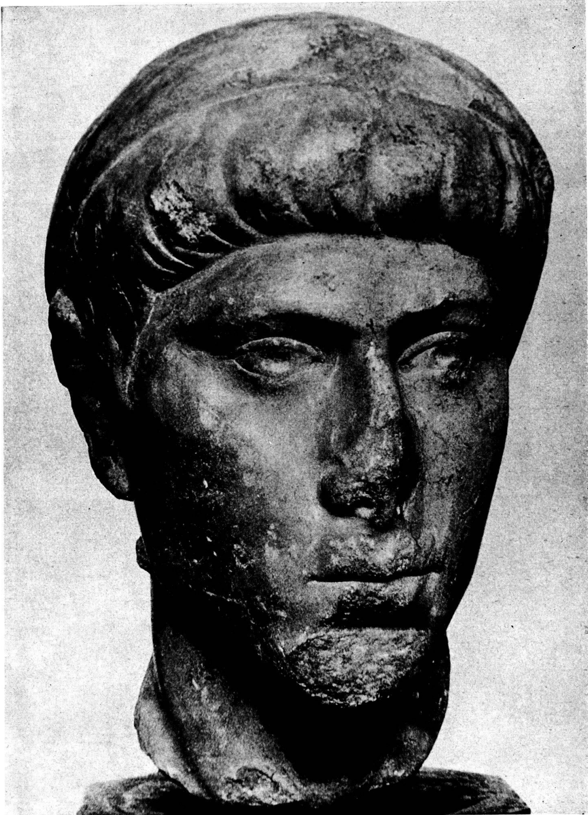
Tafel 1. Constantius II. als Caesar, verschollen.