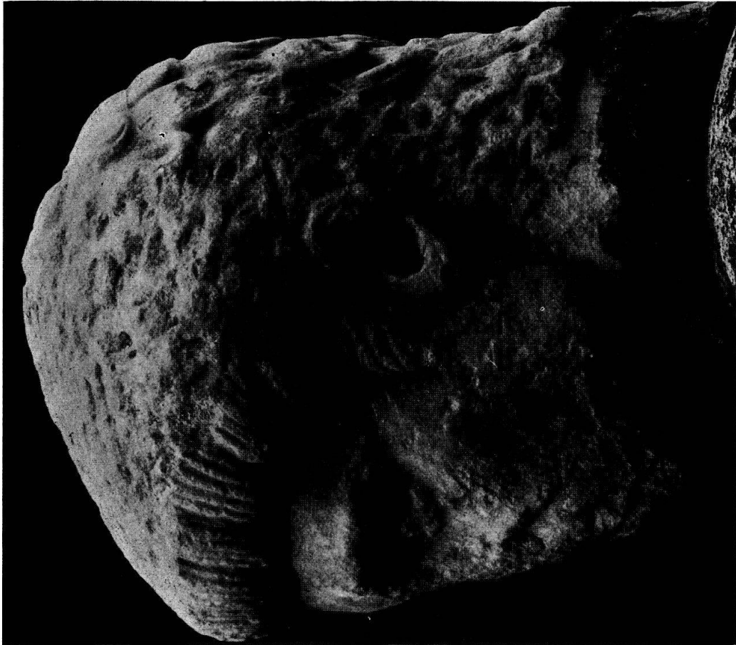
Tafel 3. Constantius II. als Caesar (?), Istanbul.